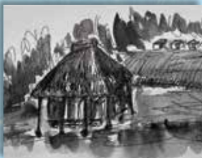
終戦後のカヤブチムラー