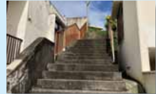
ウサン嶽の入り口