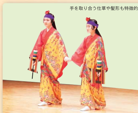
手を取り合う仕草や髪形も特徴的

宮平の総掛は「干瀬節」「七尺節」「サアサア節」の三曲になっており、古典女踊りの伝統的な型を受け継いでいます。