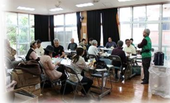
現ガイドの話聞く様子