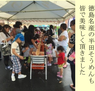
徳島名産の半田そうめんも皆で美味しく頂きました

文化センターで上映されたウルトラマンは、子どもだけでなく大人も子ども時代を思い出しながら一緒に楽しんでいました。ご来場くださった皆様からは「楽しかった」「また来たい」との声をたくさん頂くことが出来ました。イベントに出店・協力してくれた方々、ボランティアの皆様、そしてご来場くださった方々、本当にありがとうございました！