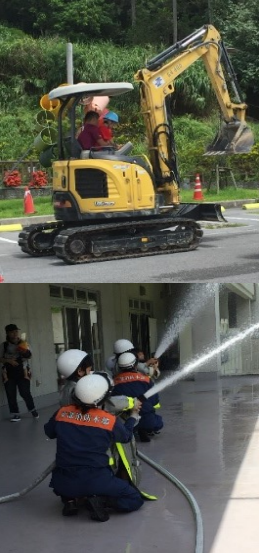
お仕事体験をする子どもたち

中でもお仕事体験は大人気で、今年は、「クッキー作り体験」・「演劇体験」・「病院体験」・「消防体験」・「看護体験」・「美容師体験」・「記者体験」・「警察体験」・「働く車体験」と、多