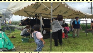
酪農体験もありました♪