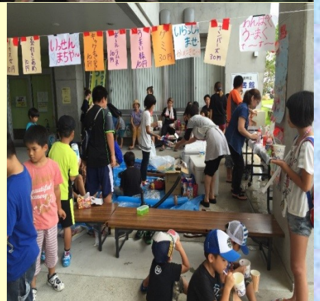
懐かしの一銭まちや〜。むかし遊びも楽しめました♪

くの方々の協力を得て九つもの体験メニューを開くことが出来ました。子ども達は皆真剣な表情で取り組んでおり、終わった後誇らしげに体験したことを大人達に語っていました。