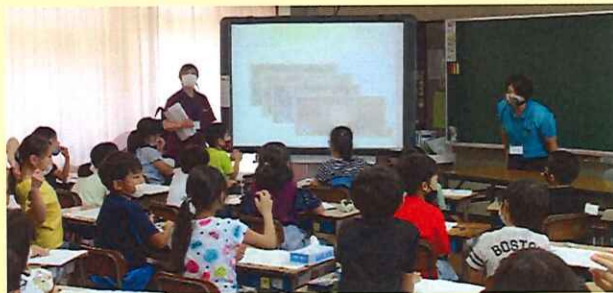
小学校福祉出前講座 (福祉教育の推進)

所在地： 南風原町字宮平 697 番地 10 (南風原町総合保健福祉 防災センター内) 電話：098-889-3213