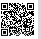
↑イベント等の詳細はこちら