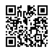
↑屋外戦跡案内の詳細はこちら