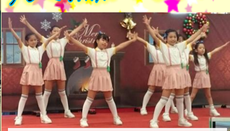
12/24出演のイオン南風原クリスマスイベントの様子。2017年最後のイベントは、いつもお世話になっている「イオン南風原」で締めくくりました!