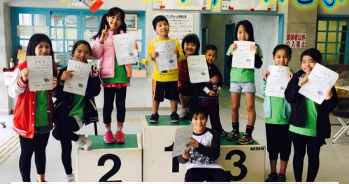
1/7の第38回新春マラソン大会 2018年最初のイベントは、毎年恒例の新春マラソン大会!! 開会式でダンスを披露した後、みんなで走り、完走しました!