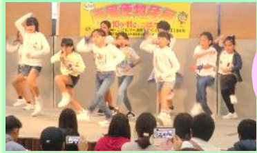
ダンススクールも出演!2 回目の舞台 となったよ!