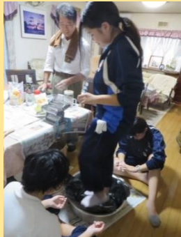
沖縄そば作り体験

南風原町観光協会では随時受入民家さんを募集しています。お気軽にお問い合わせください♪