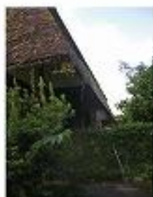
金城家 (屋号: 新門ノ前)